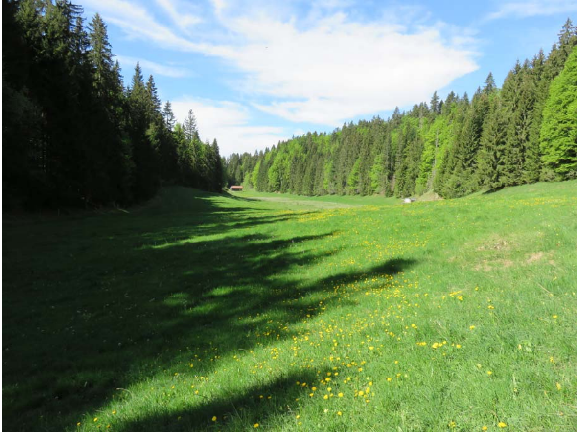
A l'Etang, avec le stand et les cibleries. La clairière fait donc 300 mètres de long.