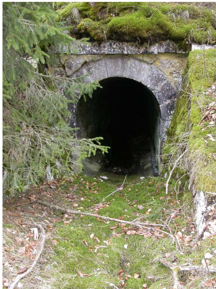
Par où passent les eaux de l'Etang. Quand il y en a !