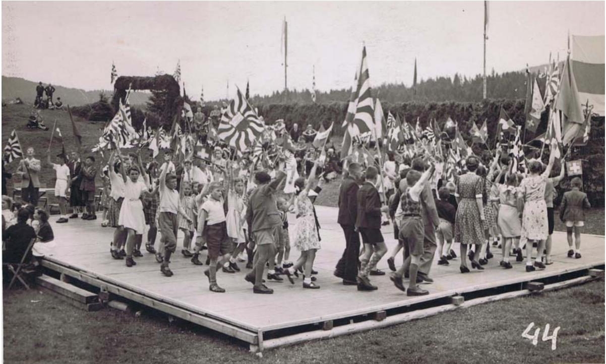
Les portes étaient grandes ouvertes sur un avenir radieux pour tous.