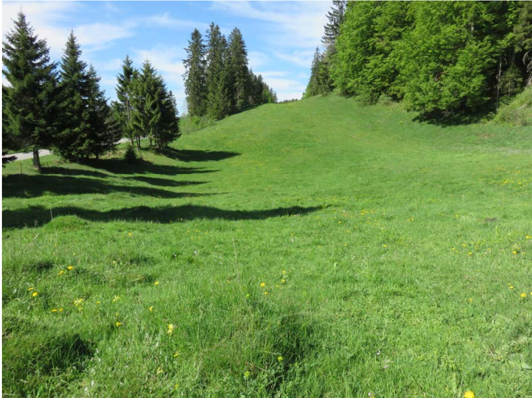
Le Creux de l'Etang, à quelque deux ou trois cents mètres de l'Etang lui-même.