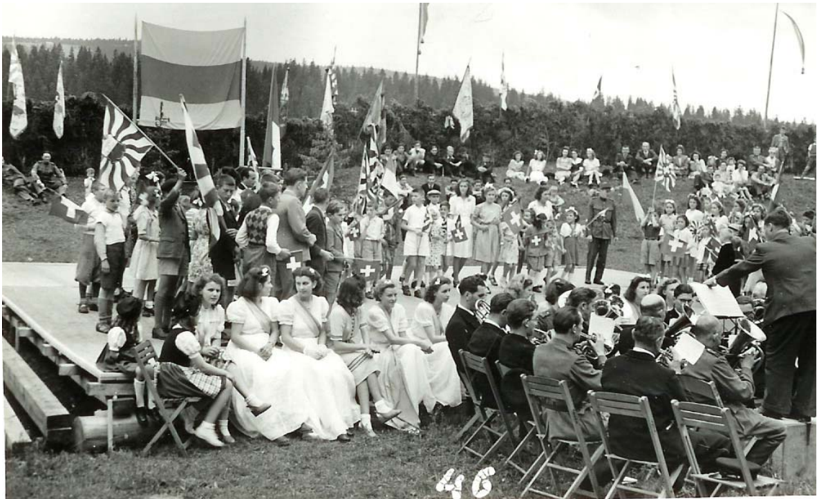
Et les filles étaient jolies, en ce temps-là !