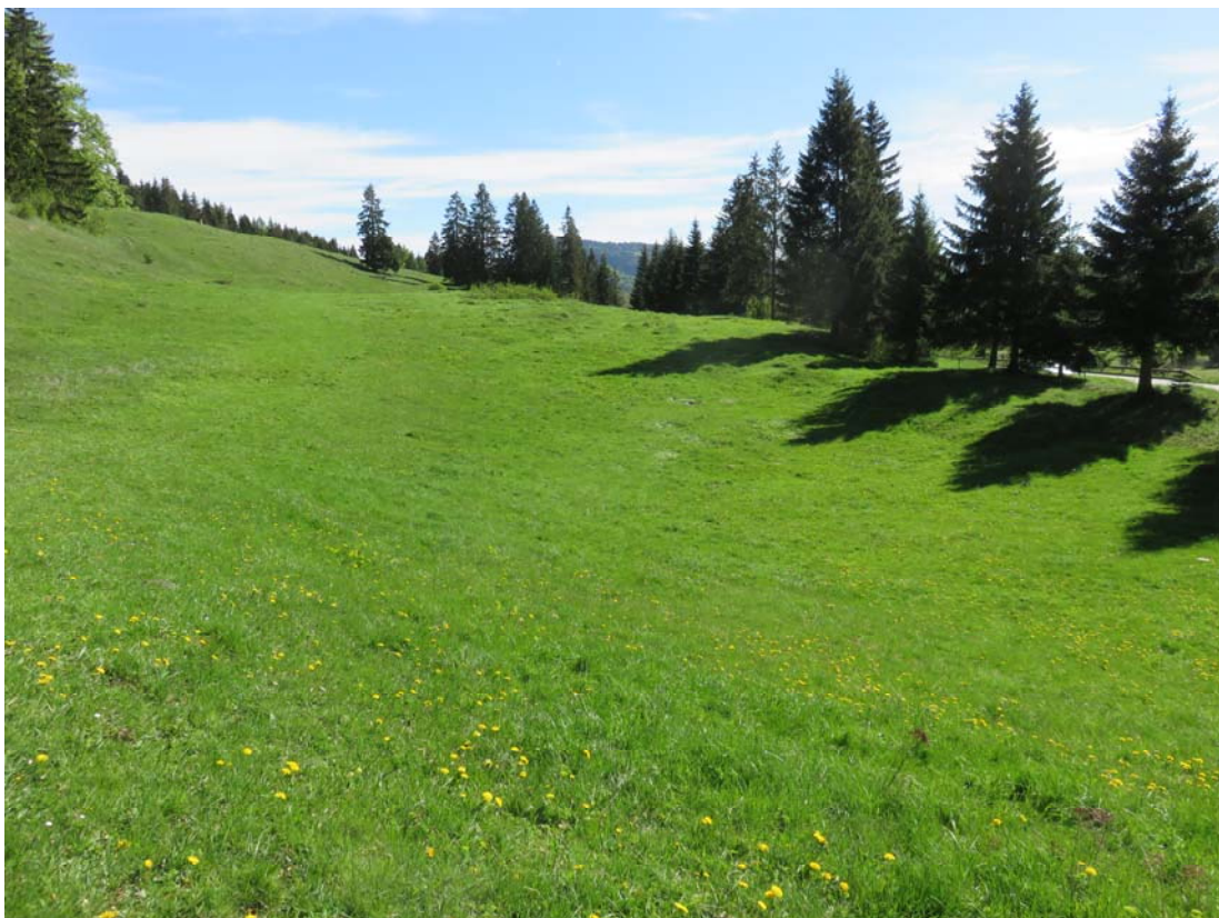
Là où ils placèrent leur pont de danse.